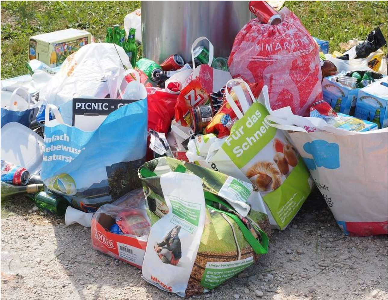
Forhåbentlig kommer der ikke til at se sådan ud omkring skraldespandene i Marielyst.