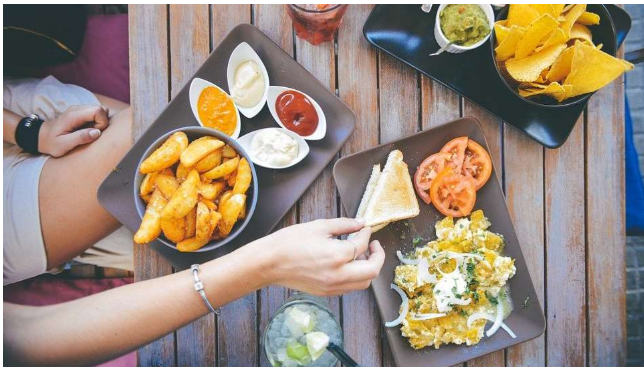
En frokost i sommerhuset er nu engang hyggeligere, når den ikke akkompagneres af larmende haveredskaber.

formand@marielyst-grundejerforening.dk eller info@marielyst-grundejerforening.dk