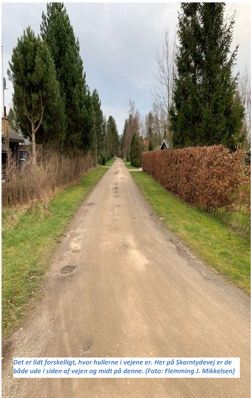
Det er lidt forskelligt, hvor hullerne i vejene er. Her på Skarntydevej er de både ude i siden af vejen og midt på denne.

Men indtil videre er bestyrelsens opfordring, at I som trafikanter/medlemmer /grundejere må væbne jer med tålmodighed lidt endnu. Vejene bliver repareret, så snart det er muligt.