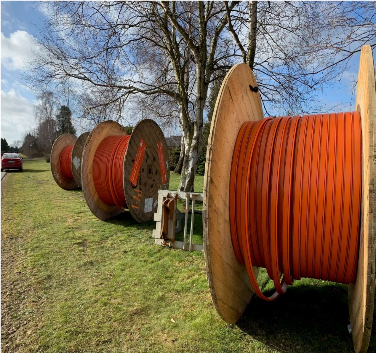
Store kabeltromler med fibernet ses rigtigt mange steder i den sydlige del af Marielyst for tiden.