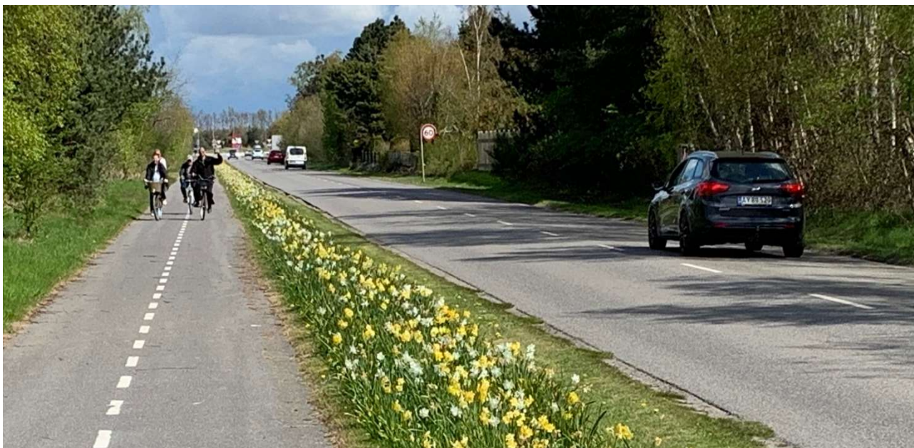
Fra Marielyst Strandvej til Godthåbs Alle (øverste foto) er der allerede en fin, bred cykelsti...men fra Godthåbs Alle og ned til Bøtøskoven (nederste foto) mangler der fortsat en cykelsti.