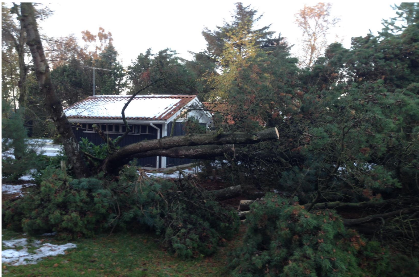
Fem gange i løbet af vinteren besøger opsynsmanden dit sommerhus for blandt andet at se, om der er træer, som er væltede.

Det sædvanlige vintertilsyn med medlemmernes sommerhuse er startet 1. november. Det løber i fem måneder her i vinter, hvor foreningens 'opsynsmand' besøger samtlige huse en gang om måneden. Ideen er, at han skal indrapportere til bestyrelsen, hvis han finder uregelmæssigheder ved sin gennemgang af husene.