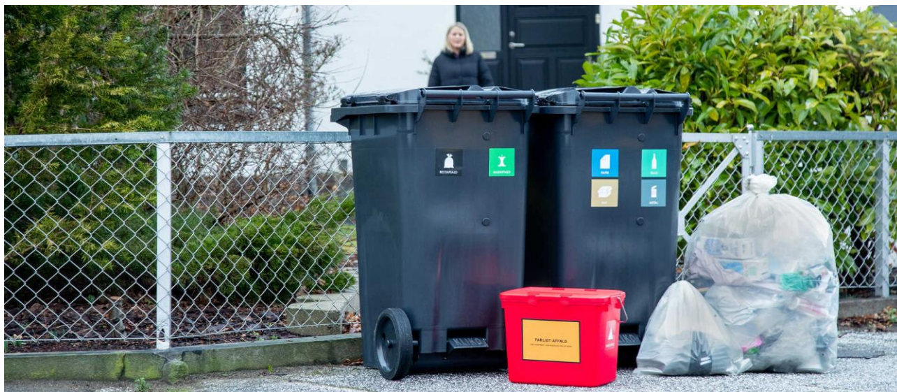
Den nye affaldsordning med to affaldsbeholdere og en plastpose blev lanceret i uge 41.