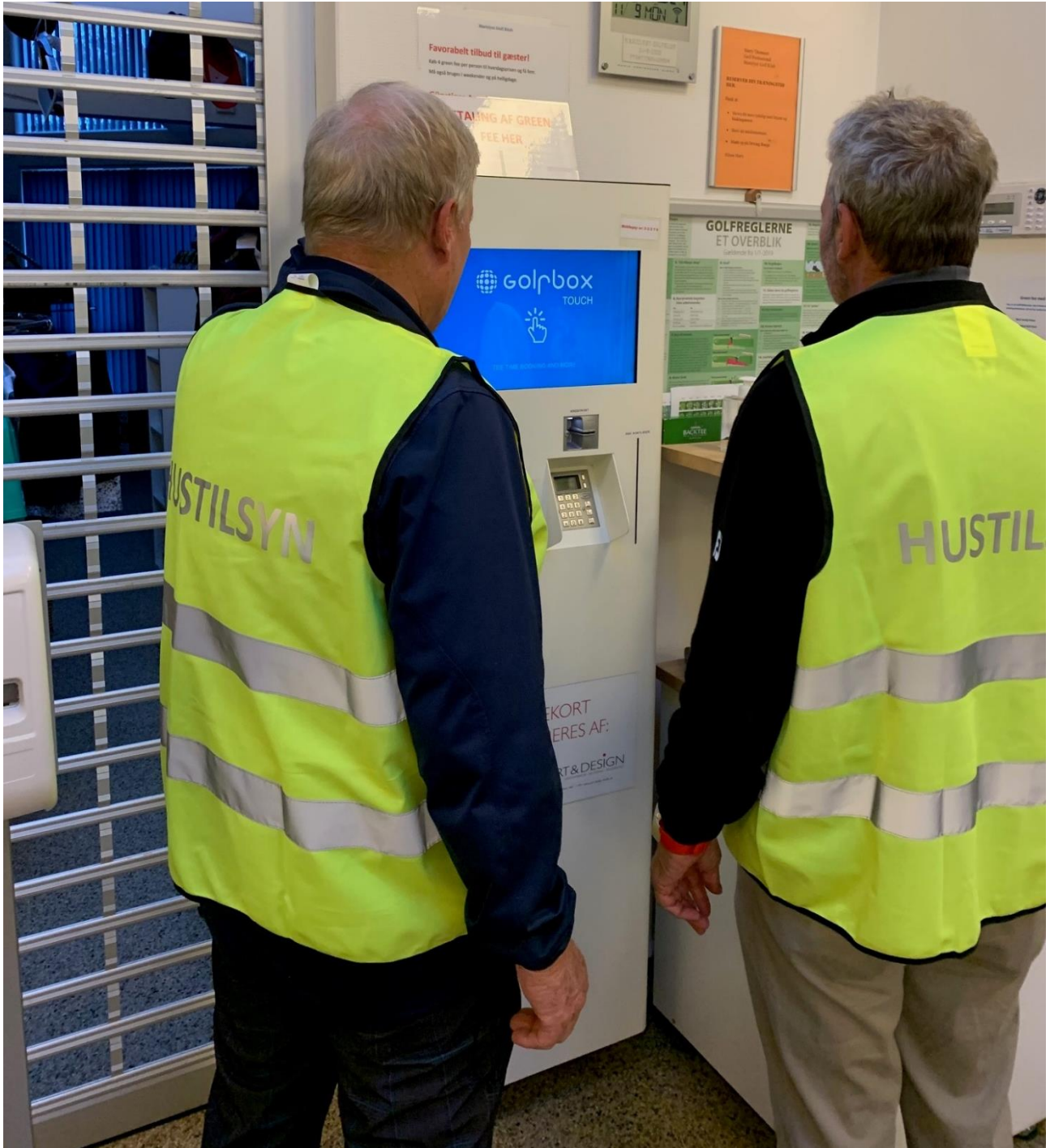
Hustilsynets folk bærer disse iøjnefaldende veste.