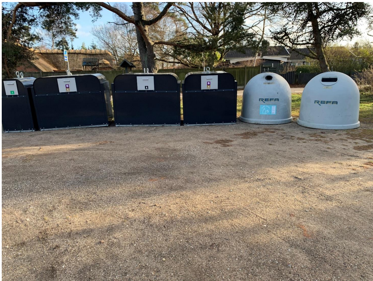
Den midlertidige miljøstation på P-pladsen bag Admiralen på Bøtøvej.