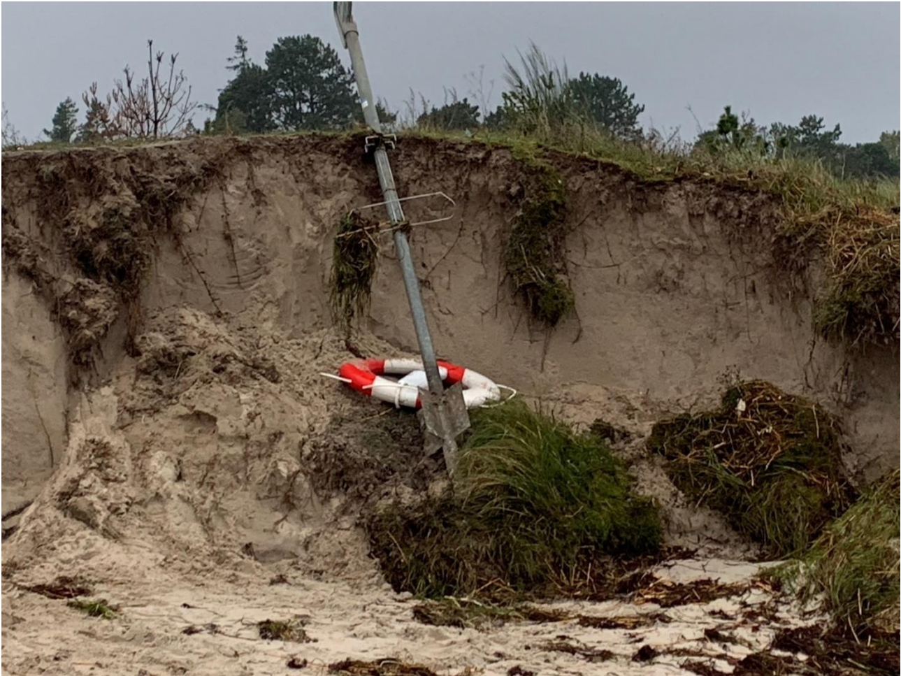
Diget i Marielyst- her ved Bøtøskoven - den 21. oktober efter at stormfloden havde trukket sig tilbage.